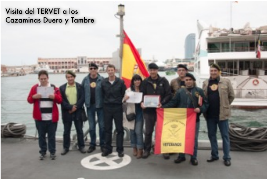
Visita a Los cazaminas Duero y Tambre. Barcelona